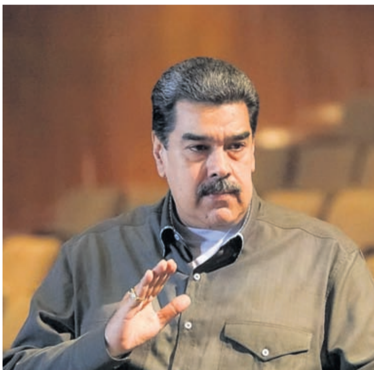
(ElNacional) - Presidente di Venezuela, Nicolas Maduro, a declara cu e ta cla pa normalisa rela-

politana. E yamada na participa den e proceso di urgencia a wordo publica diaranson y diahuebs, 28 y 29 di december. E asignacion ta poni pa dia 30 di maart y e firma di e contractnan pa dia 20 di april.